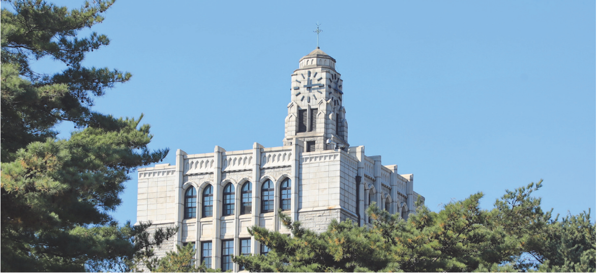
고려대학교 문과대학 (시계탑이 있는 건물) (高麗大学 文科大学, 時計塔がある建物)